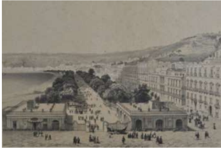
Fig. 50 La Villa di Chiaia dopo il primo intervento (inc. 1698)

a palazzo, dopo che era stato dato l'ordine, che per la mattina successiva, quantunque giorno di solenne festività, si convocasse il Consiglio della Corona.