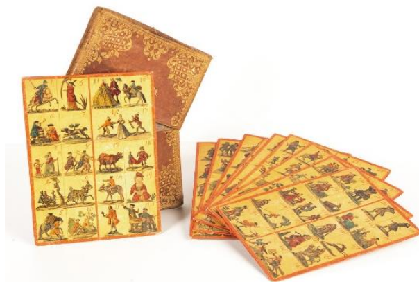
Fig. 38 Schede del gioco della Cavagnola (inc. sec. XVIII)

Nel pomeriggio si diressero in carrozza a Milano, dove all'opera assistettero ad un balletto e ad una commedia in due atti, che si prolungò fino a notte inoltrata. Maria Carolina nel suo diario confessa che si era adeguata al modo di vivere della cognata, solo per educazione e poiché era senza la compagnia del re Ferdinando. Infatti, scrive di avere pranzato alle quattro del pomeriggio e di avere cenato all'una di notte, abitudini molto lontane dalle sue, e che, ritornata nel suo appartamento, passato oramai il sonno, era stata a scrivere fino al mattino.