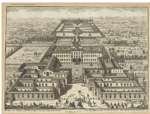
Fig. 37 Oreno. Villa Gallarati Scotti (inc. M. Dal Re post 1743)

Nel Caffeaux fu imbandita una squisita merenda, durante la quale si alternarono due numerose bande di suonatori, una delle quali fornita di Strumenti Rusticali 37 .