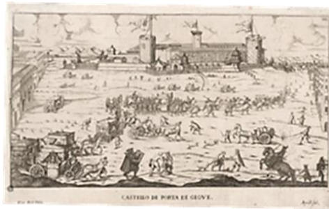
Fig. 33 Milano. La piazza del Castello Sforzesco (Acquaforthe 1674)

Lunedì mattina il re con il cognato si recò sulla piazza del Castello(fig. 33) a vedere le evoluzioni militari e gli esercizi a fuoco del Corpo dei Granatieri, composto di quattro Compagnie del Reggimento Caprara e due del Reggimento Belgioioso.