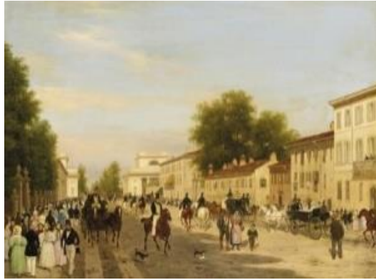
Fig. 32 Milano. Il Corso di Porta Orientale (dip. Canella 1834).

La sera intorno a mezzanotte andarono al Teatro grande della Scala 6 , nel quale si rappresentò la nuova opera buffa Il Talismano 7 con tre balletti coreografici di Sebastiano Gallet: Il signore Benefico , il Bajram de' Turchi e L'amore vincitore . La rivista "La Gazzetta universale" 8 così la descrive: