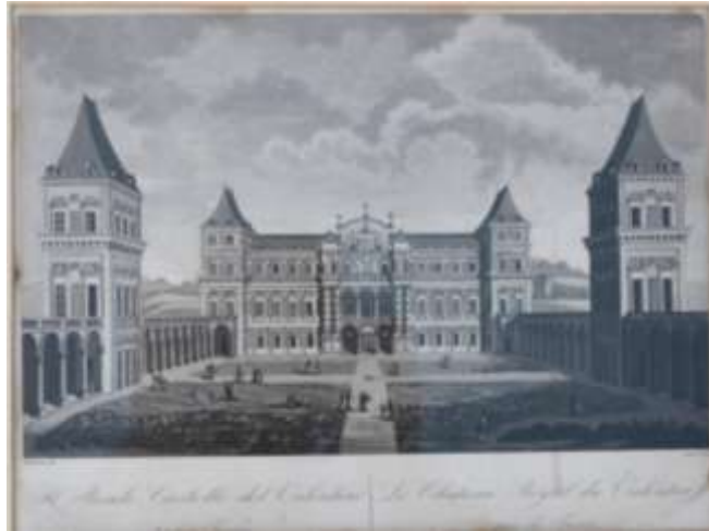
Fig. 30 Torino. Passeggiata al parco del Valentino. (Inc. Angeli 1824)

della sua Corte se ne partì intorno alla mezzanotte per Susa, da dove passò a visitare le Fortezze di Euilles e della Brunetta 42 .