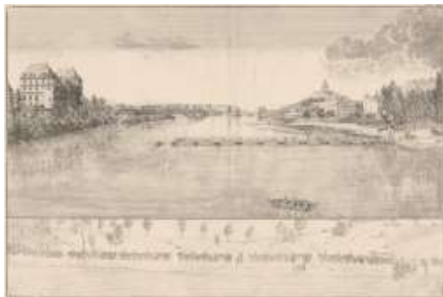
Fig. 29 Torino. Il Castello del Valentino (inc. P. Gardet 1835)

del palazzo rivolti verso il Po, osservarono ibattelli illuminati dai quali proveniva la musica. Sulle colline i Casini delle Vigne, anch'essi superbamente illuminati, e lungo