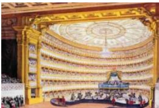
Fig. 24 Torino. La sala del Teatro nel 1839 vista dal palcoscenico

compagnia della famiglia reale e di molte persone della corte al Regio Teatro 25 (fig. 24), per l'occasione tutto illuminato a festa, per assistere all'opera "La disfatta di Dario" 26 . Ritornati a casa del marchese del Gallo cenarono insieme a Don Antonio Micheraux, ministro del re Ferdinando a Venezia.