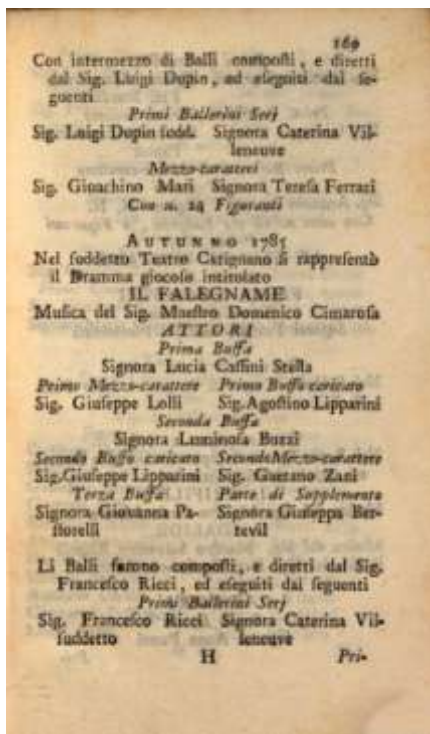
Fig. 26 Testo a stampa dramma giocoso IL FALEGNAME

La mattina di venerdì ventiquattro il re si fece condurre in carrozza alla Cittadella 33 (fig. 26) per osservarla minuziosamente. La regina, invece, dopo essersi