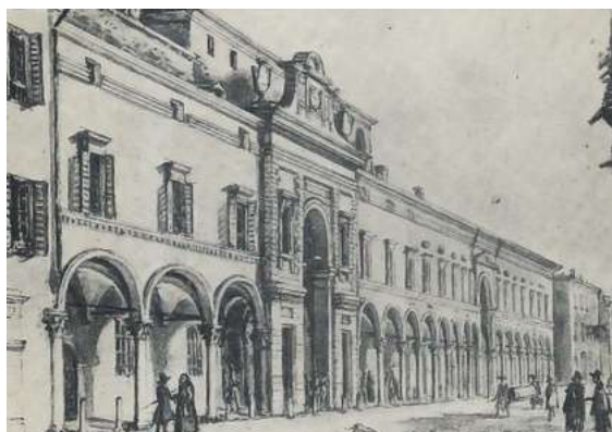
Fig. 21 Parma. Ospedale della Misericordia (inc. XIX sec.)

Il giorno dopo il re andò a visitare la fortezza di Tortona 19 (fig. 22) e al suo ritorno, dopo aver cenato, tutti insieme ripartirono in nottata per Alessandria.