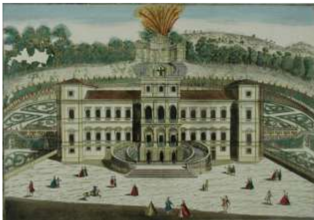
Fig. 31 Torino. La vigna della regina. (ca.1770)

Il giorno seguente si recarono in carrozza con il loro seguito alla Vigna della Regina 45 , una sontuosa residenza di campagna con annessi vigneti e stupendi giardini (fig. 30). Il giardiniere a cui furono presentati, offrì loro dei fiori che furono molto graditi e per questo ricevette in regalo dodicizecchini. Di ritorno s'intrattennero per qualche ora dalla contessa