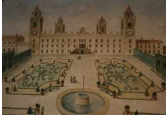
Fig. 19 Parma. Reggia di Colorno. Dipinto a tempera su tela metà sec XVIII

La mattina del dodici, dopo una visita alla città di Parma, pranzarono alla villa e successivamente nel giardino assistettero alla giostra di ventiquattro cavalieri, vestiti all' eroica, che con i rispettivi cavalli a ritmo di musica imbastivano un balletto a cavallo. Durante questo soggiorno avevano ricevuto in dono un opuscolo di 6 fogli in 8° con una cantata 3 del poeta italiano l'abate Gaetano Sertor 4 , dal titolo Per la venuta in Parma del Signor Conte e della Signora Contessa di Castellammare .