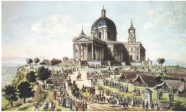
Fig. 32 Torino La Basilica di Superga (inc. 1831)

Fatto ritorno in tarda mattinata, dopo aver pranzato andò come al solito a passeggio sul Valentino e alla Cittadella e la sera, unitamente alla Regina sua consorte, si recò a corte per il Ballo de Dominò 48 .