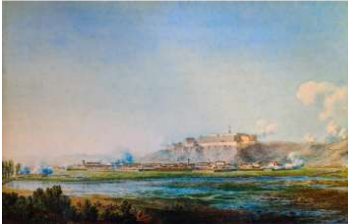
Fig. 22 Tortona. Fortezza (dipinto di G.P. Bagetti 1796)

Qui giunti si diressero alla Cittadella 20 (fig. 24) per assistere alle manovre militari e, dopo aver visitato il quartiere dei soldati e l'ospedale, si recarono a teatro civico ad assistere ad un'opera buffa, Le Astuzie di Bettina, composta da Stabinger, Mathias