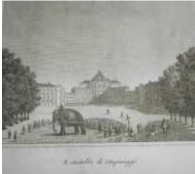
Fig. 25 Torino. Il Castello di Stupinigi (Audot 1837)

La sera fecero ritorno al loro alloggio per la cena, che fu allietata dalla musica di un complesso di orchestrali, ai quali il re, in segno di gradimento, regalò cinquanta zecchini.