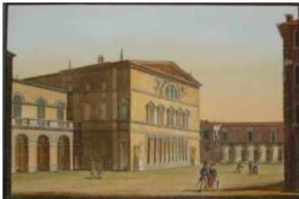
Fig. 20 Parma. Nuovo Teatro Ducale (inc. Zaccagni – Orlandini sec. XIX)

sera intervennero ad una festa da ballo tenutasi nel Nuovo Teatro Ducale 11 (fig. 20), che per l'occasione fu trasformato in salone.