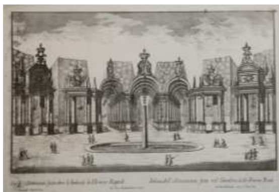
Fig. 28 Torino. Veduta della Veneria reali con i giardini. (inc. 1737)

una grossa fabbrica di seta del banchiere Giuseppe Maria Arnaud. Il modo in cui veniva lavorata la seta destò particolarmente l'interesse del re che osservò bene le varie fasi del processo di manifattura, in particolare la qualità dei bozzoli e i filatoi idraulici, quindi dopo aver lasciato per mancia la somma di duecento zecchini da distribuirsi a tutti gli operai, proseguirono per la Venaria, dove si intrattennero per tutto il pomeriggio, visitando gli appartamenti, il parco, gli aranceti, la galleria e le scuderie.