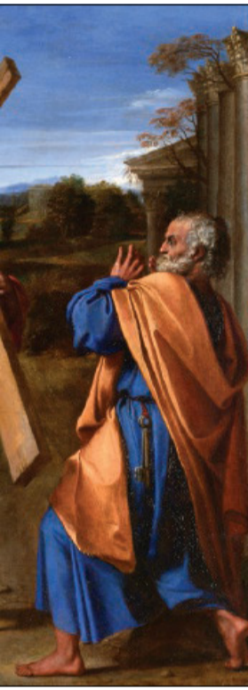
In alto: Annibale Carracci, «Domine, quo vadis?» (1601)