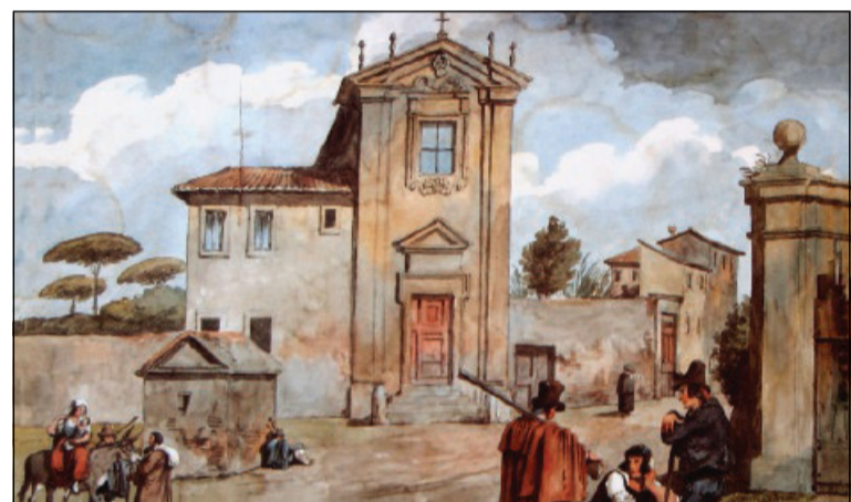
Achille Pinelli, «Chiesa del Quo Vadis» (1834)

La strada era deserta. I contadini che conducevano i legumi alla città non avevano ancora attaccati i cavalli ai veicoli, e per lo stradone, tutto lastricato di pietre fino alle montagne, non si udiva che il cupo suono dei sandali di legno dei due viandanti.