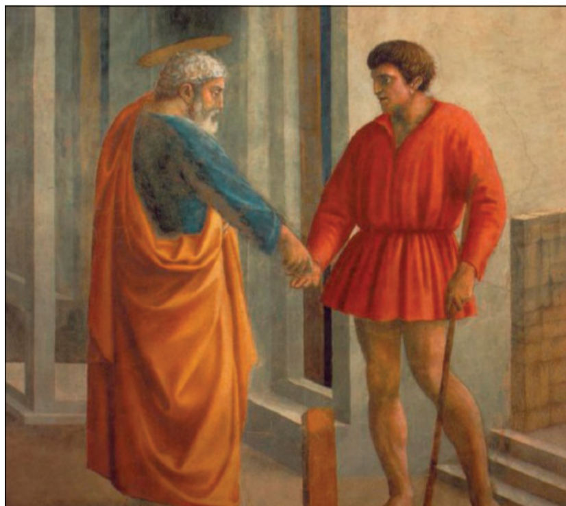
Masaccio, «Il pagamento del tributo»

Il legame con Simon Pietro è dato proprio dal coinvolgimento con il quale Simone è fatto partecipare alla testimonianza di Gesù. Masaccio nell'allineare il gesto delle braccia destre distese del Maestro e del suo