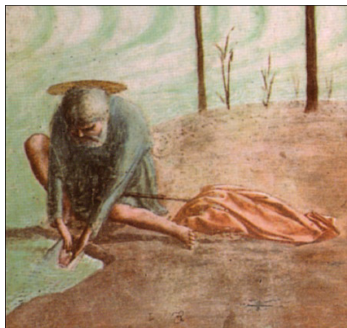
Masaccio, «La pesca di Pietro» (Cappella Brancacci a Santa Maria del Carmine, Firenze)

Una domanda è lecito porsi qui: poiché, come risulterà evidente, tutti gli affreschi sono a coppie e, nella coppia, il primo è a sinistra e il secondo a destra del visitatore della Cappella, come mai in questa prima coppia, quello che è cronologicamente primo è, invece, a destra? Certo questa distonia, lascia almeno intuire che a quella bellezza originaria si potrà tornare, poiché non appartiene solo al passato, ma, nel dono dell'Incarnazione e della vita della Chiesa, da Pietro rappresentata, è data all'uomo la via per recuperare la bellezza originaria dei progenitori.