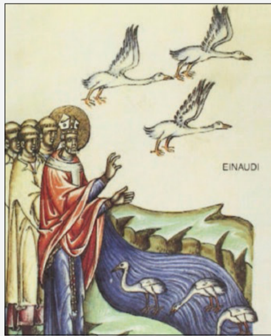
Particolare dalla copertina dell'edizione Einaudi del 1995

In quello stesso giorno Pietro e Paolo apparvero a Dionigi, secondo quanto egli stesso racconta nella citata lettera, e gli dissero queste parole: «Bada al miracolo, vedi il prodigio, fratello mio Timoteo, del giorno del loro sacrificio. Infatti ero molto vicino nel momento in cui furono separati: ma subito dopo la loro morte li vidi che per mano entravano per le porte di Roma, vestiti di vesti di luce, e adorni di corone di splendore e di luce». Questo dice Dionigi.