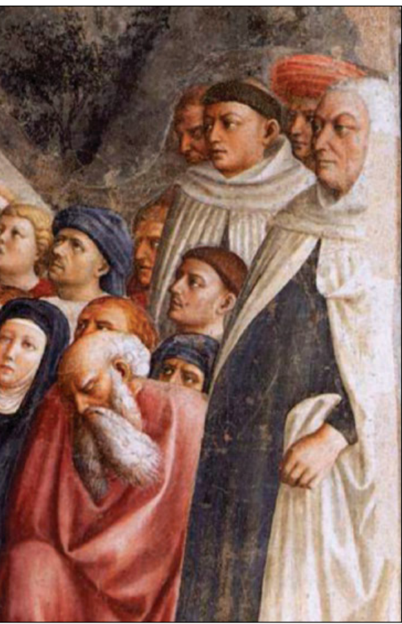
Masolino, «La predica di san Pietro» (1426-1427)

ricope del tributo si tratta, piuttosto, della tassa dovuta al Tempio – un parallelo, ma non di questo si tratta, potrebbe essere piuttosto addotto per una offerta rivolta alla Chiesa. Il brano evangelico è tutto teso a mostrare che Gesù è il Figlio di Dio, e perciò anche il padrone del Tempio.