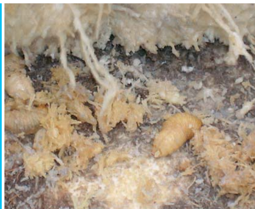
Diverse larve che si nutrono del tessuto interno della palma