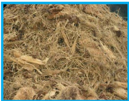
Tronco di palma dopo la cippatura