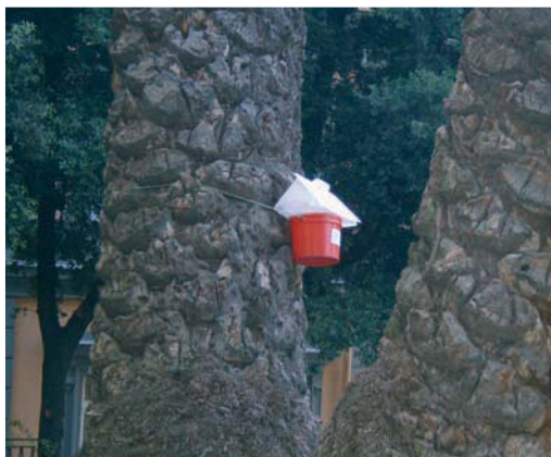
Trappola attrattiva per il monitoraggio della presenza del punteruolo