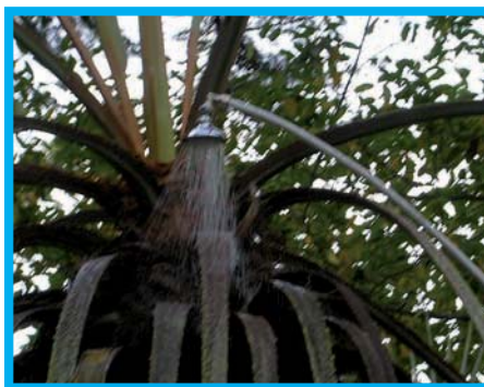
Trattamento con doccia